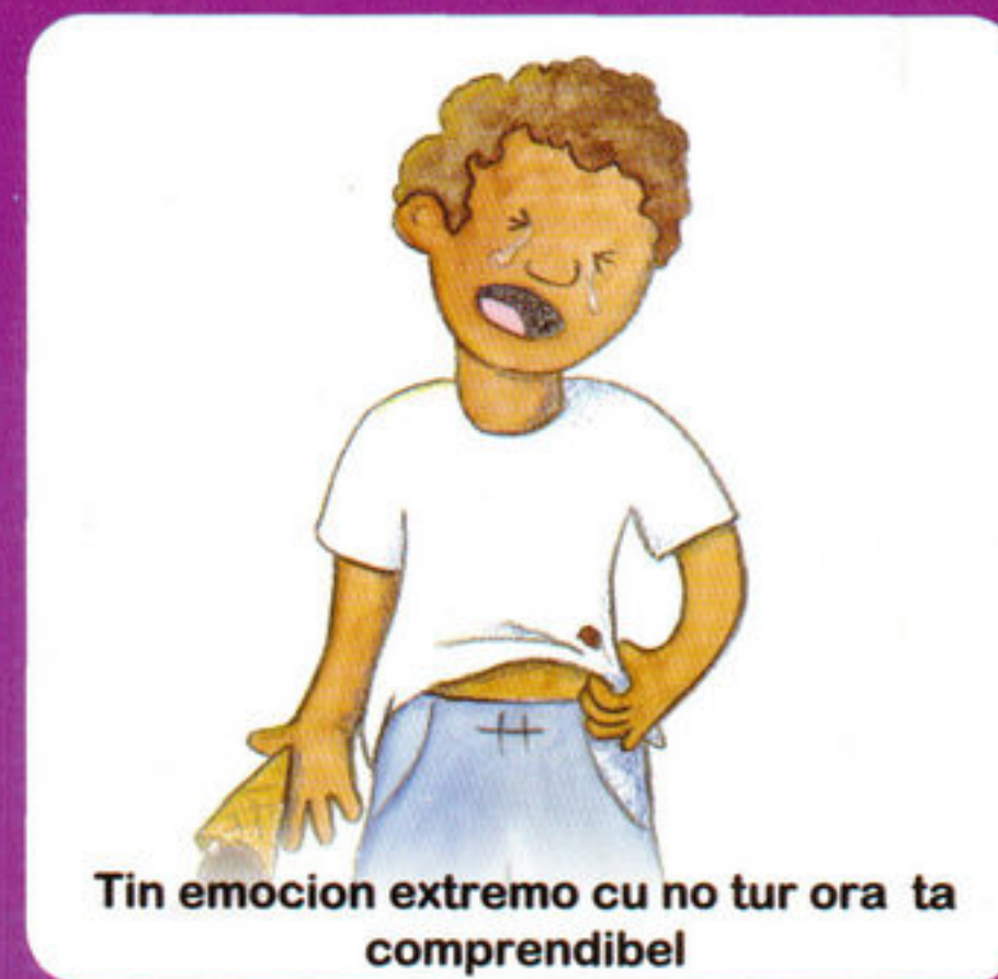
Tin emocion extremo cu no tur ora ta comprendibel